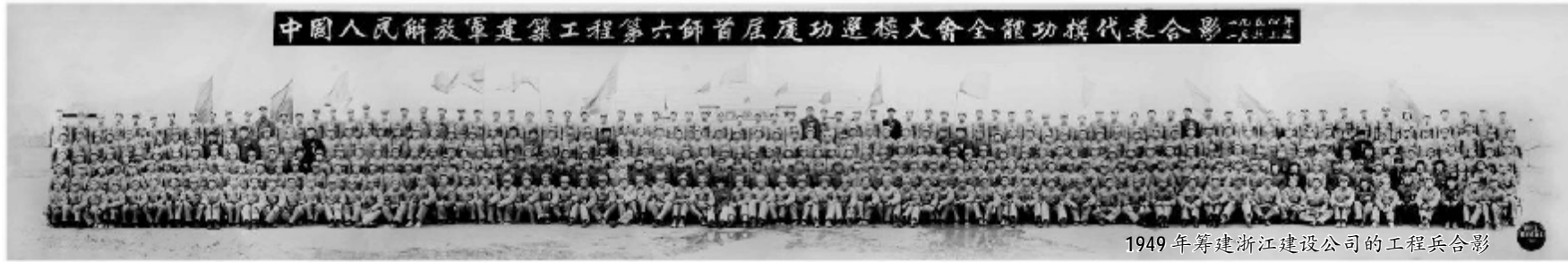
1949年筹建浙江建设公司的工程兵合影

在“水豆腐”上建起杭州火车东站 从北京人民大会堂、北京火车站到 G20 系列工程 浙建集团紧跟国家建设鼓点