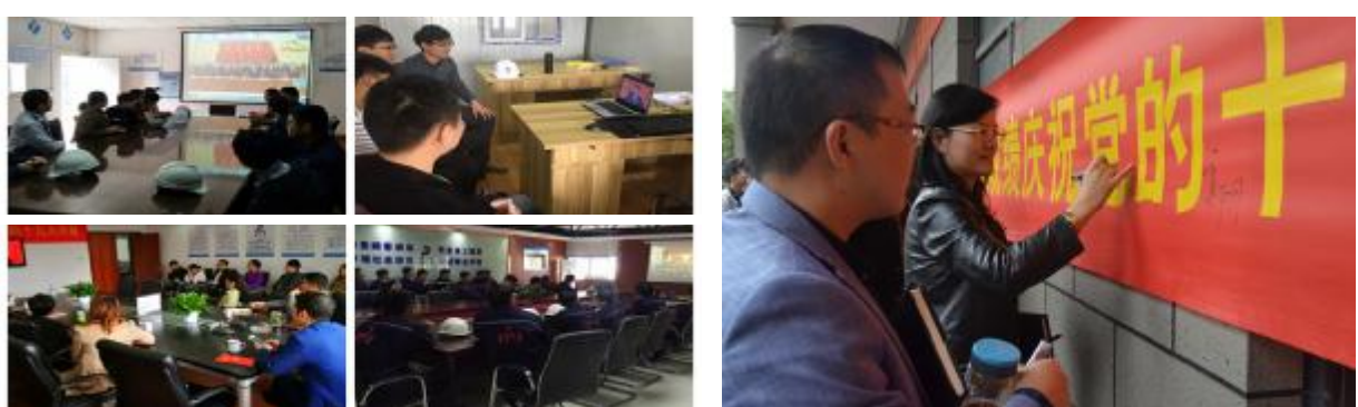
10月18日上午九时,举世瞩目的中国共产党第十九次全国代表大会在北京人民大会堂隆重开幕,集团党委组织广大党员职工收听收看大会开幕式。集团党政领导、中层管理人员、党员职工等300余人,分别在所在单位、项目部集中观看收听直播,通过微信、QQ等平台进行交流,畅谈学习体会。(党群工作部)